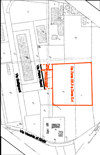
Stralcio PRG95 - 1/5000 Tav 6 Godo ovest